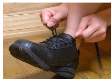
正しい履き方指導